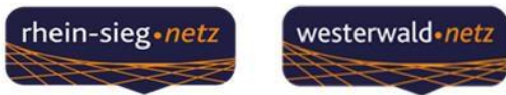
Abbildung 2: Logo der RSN und WWN

Die Netztöchter der rhenag grenzen sich zunächst markenrechtlich von der Vertriebsmarke der rhenag ab. Sie haben eigene Logos, die eine Verwechslungsgefahr mit dem Vertriebsunternehmen „rhenag“ ausschließen. Die Netzgesellschaften verfügen außerdem über eine vollständig eigenständige Geschäftsausstattung unter Verwendung des jeweiligen Firmenlogos.